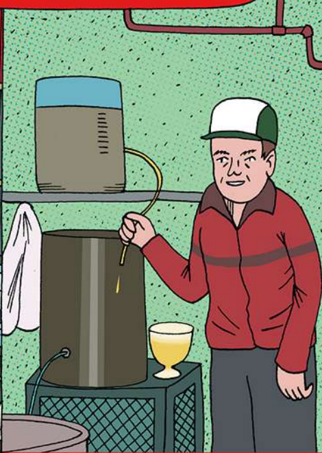
Een zelf gebrouwd streekbier, naar aloud familie-recept.