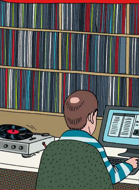
Het digitaliseren van de vinylplatencollectie.