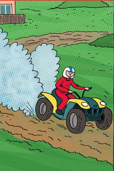
Racen met de quad op een zelf aangelegd parcours.