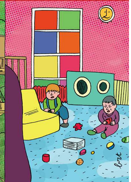
Twee peuters die lange uren maken in kinderdagverblijf Het Egeltje.