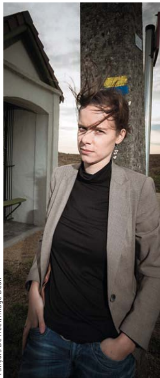
François De Heel/Image Desk

Het rapport is na te lezen via: www.stichtingpv.be